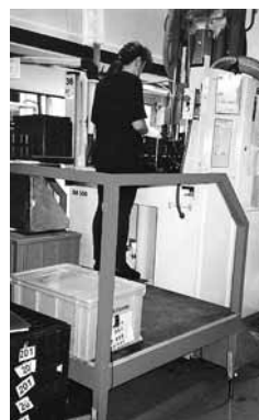
Figura 4: macchina ad iniezione con pedana di lavoro regolabile in altezza tramite dispositivo elettrico.