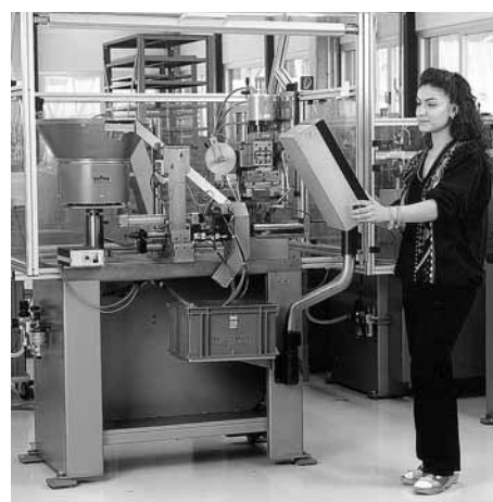
Figura 8: pulsantiera ad un'altezza ottimale per la visualizzazione e la manipolazione dei comandi.