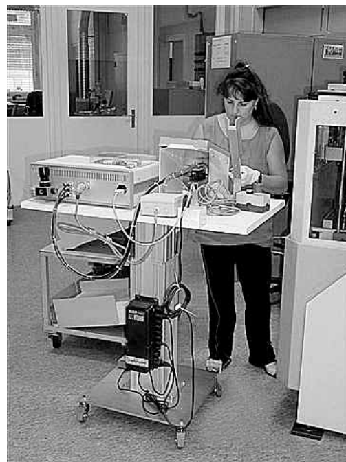
Figure 1 e 2: semplici accessori come carrelli elevatori e piani di lavoro mobili su montanti girevoli e regolabili in altezza permettono di assumere la posizione corretta durante il lavoro.