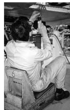
Figura 5: sedili speciali facilitano il lavoro quando bisogna lavorare con la testa reclinata.