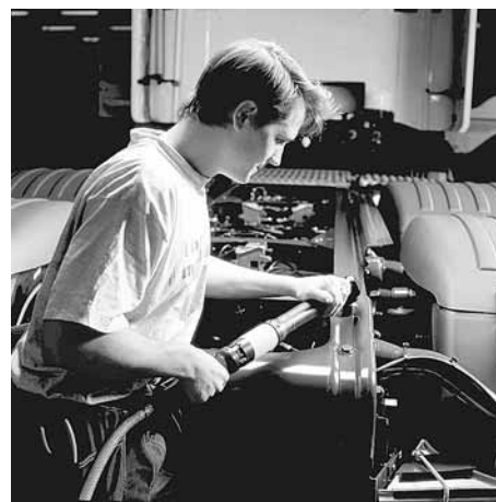
Figura 9: questo cacciavite angolare consente una postura corretta durante il lavoro.