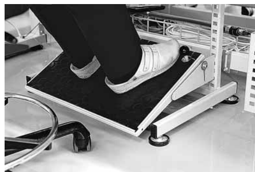
Figura 6: se i piedi non poggiano completamente sul pavimento è necessario un poggiapiedi regolabile in altezza e inclinazione.